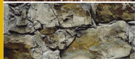
Oben: Dauerhaftes Mauerwerk mit CALCIDUR®/HYDRADUR®; Unten: Schadhaftes Mauerwerk durch falsches Bindemittel